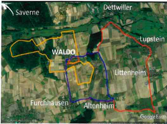
* Parcours détaillés sur le site Internet